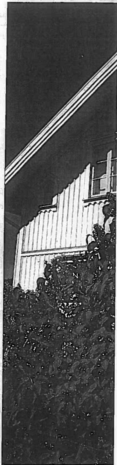
PASSAR I MILJÖN. Konsolerna till vattbaset smälter in i den gamla miljön. "Varje variant som inte ser påklistrad ut", säger